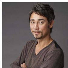
J-WAVE クリス・ペプラー