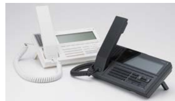
奥行き狭い場所にも設置可能なコンパクトサイズ