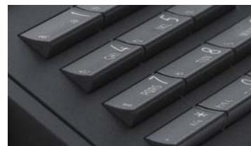
小型ながらも押しやすいボタン形状