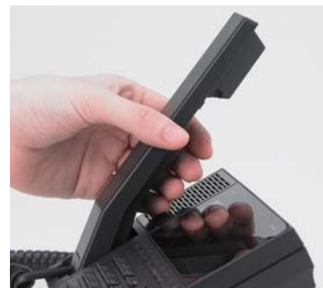
取りやすい受話器